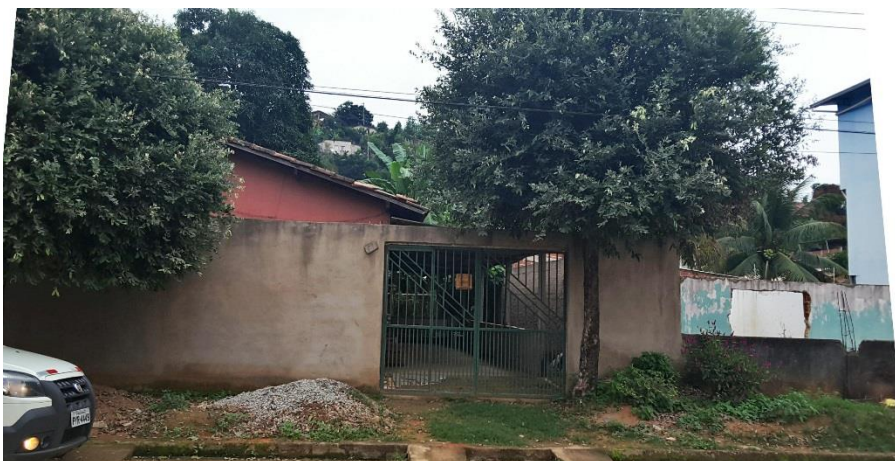
Figura 1. Registro fotográfico da visita.

No dia 09/06/2017, equipe técnica da empresa Synergia, enviou SMS para os números declarados pelo manifestante, com o objetivo que a família entre em contato com a empresa para realização do Cadastro Integrado.